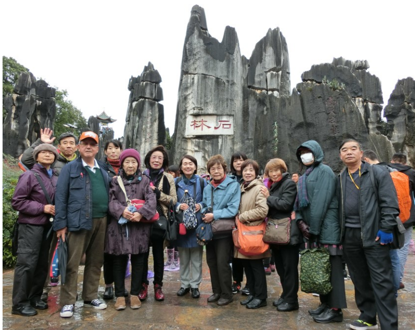
文化交流実行委員団