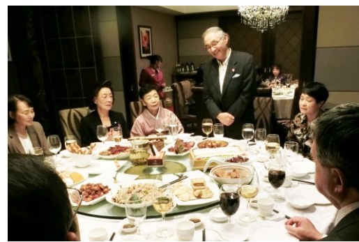
友誼館での文化交流の反省会