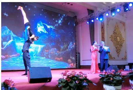
日中によるデュエット