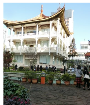
藤沢・昆明友誼館