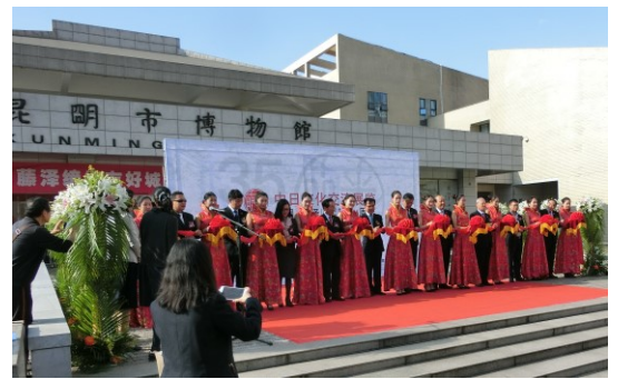
日中文化交流展オープニングセレモニー