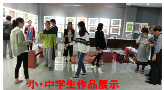
小・中学生作品展示