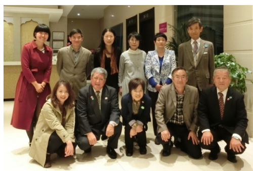
雲南日本語研究会の皆さんと交流