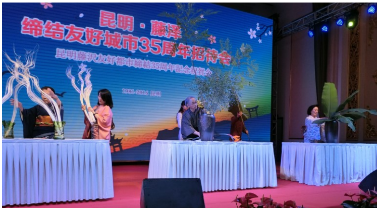
華道協会による生け花実演