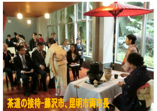
茶道の接待-藤沢市、昆明市両市長