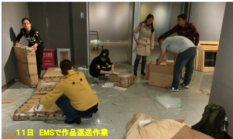
11日 EMSで作品返送作業