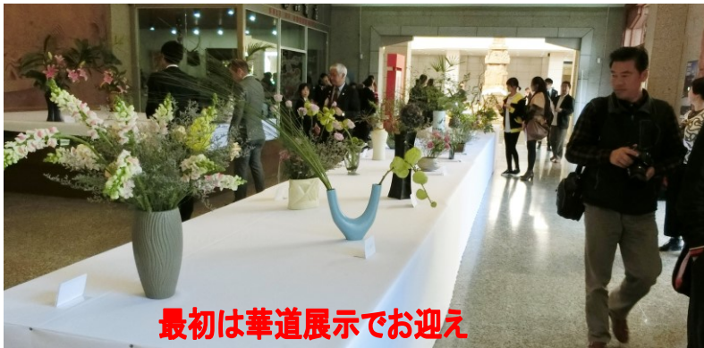
最初は華道展示でお迎え