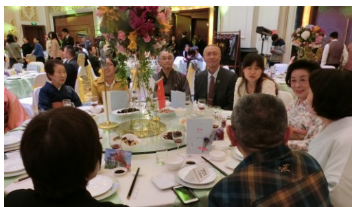
パーティー参加の皆さん