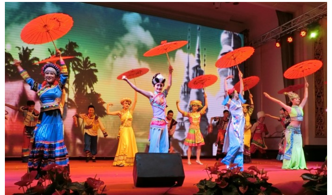
少数民族舞踊で歓迎