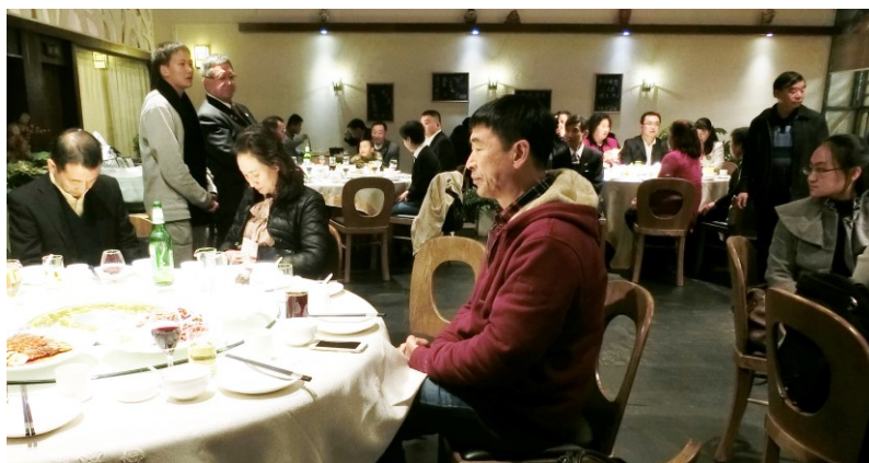
文化交流実行委員団大縫団長の感謝の挨拶