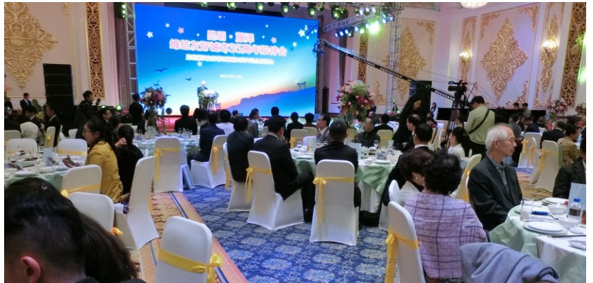
35周年記念祝賀パーティー