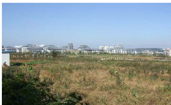
11月6日新都市視察 農地の中の市庁舎

昆明を東南アジアのハブ都市とするという中国の意気込みを実感しました。皆さん今後の昆明市の発展を注目してください。